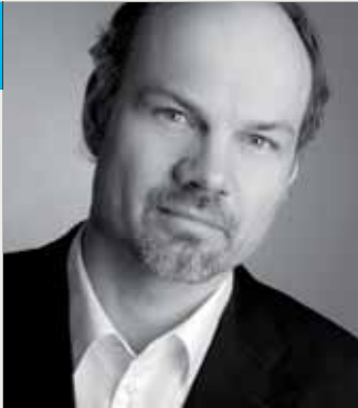
Alf Furkert , Freier Architekt Präsident der Architektenkammer Sachsen

Die Auftaktveranstaltung zum 2. Sächsischen Architektursommer 2010 unter dem Motto "Architektur ans Wasser - Baukultur ist Lebenskultur" findet am 15. Mai 2010, um 15 Uhr im Gebäude der Dresdner Bank/ Commerzbank, Dittrichring 5 - 9, 04109 Leipzig, statt. Im Anschluss daran, gegen 17 Uhr, laden wir ein zur Eröffnung der im Foyer präsentierten Ausstellungen, zum Kennenlernen und Gesprächen, zu geselligem Beisammensein mit Musik.