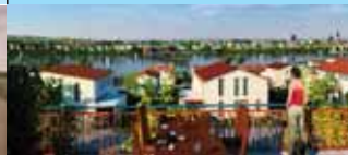
3dpixel company g.m.b.h