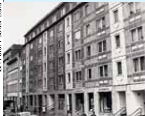
Bürgerverein Kolonnadenstraßenviertel e.V.