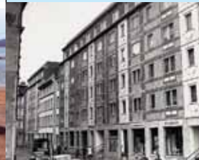
Bürgerverein Kolonnadenstraßenviertel e.V.