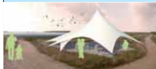
Hermisdorf/ Taubner, HTWK Leipzig