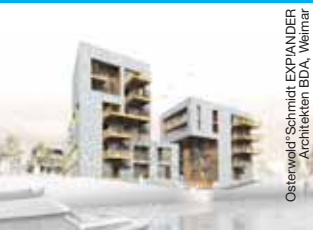
Osterwald-Schmidt EXPANDER Architekten BDA, Weimar

V Grüner Ring Leipzig Geschäftsstelle grl@isip-weiterbildung.com www.gruener-ring-leipzig.de