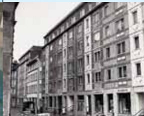
Bürgerverein Kolonnadenstraßenviertel e.V.